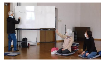
▲ 会合と農園の様子

地域振興部会では年度末にあたり、ふれあい市民農園の利用者の皆さんと栽培報告会を開きました。この農園は地元“牛淵地区”の協力を得て運営しているもので、草刈りを手伝ってくれたり、栽培するうえで助言していただいています。